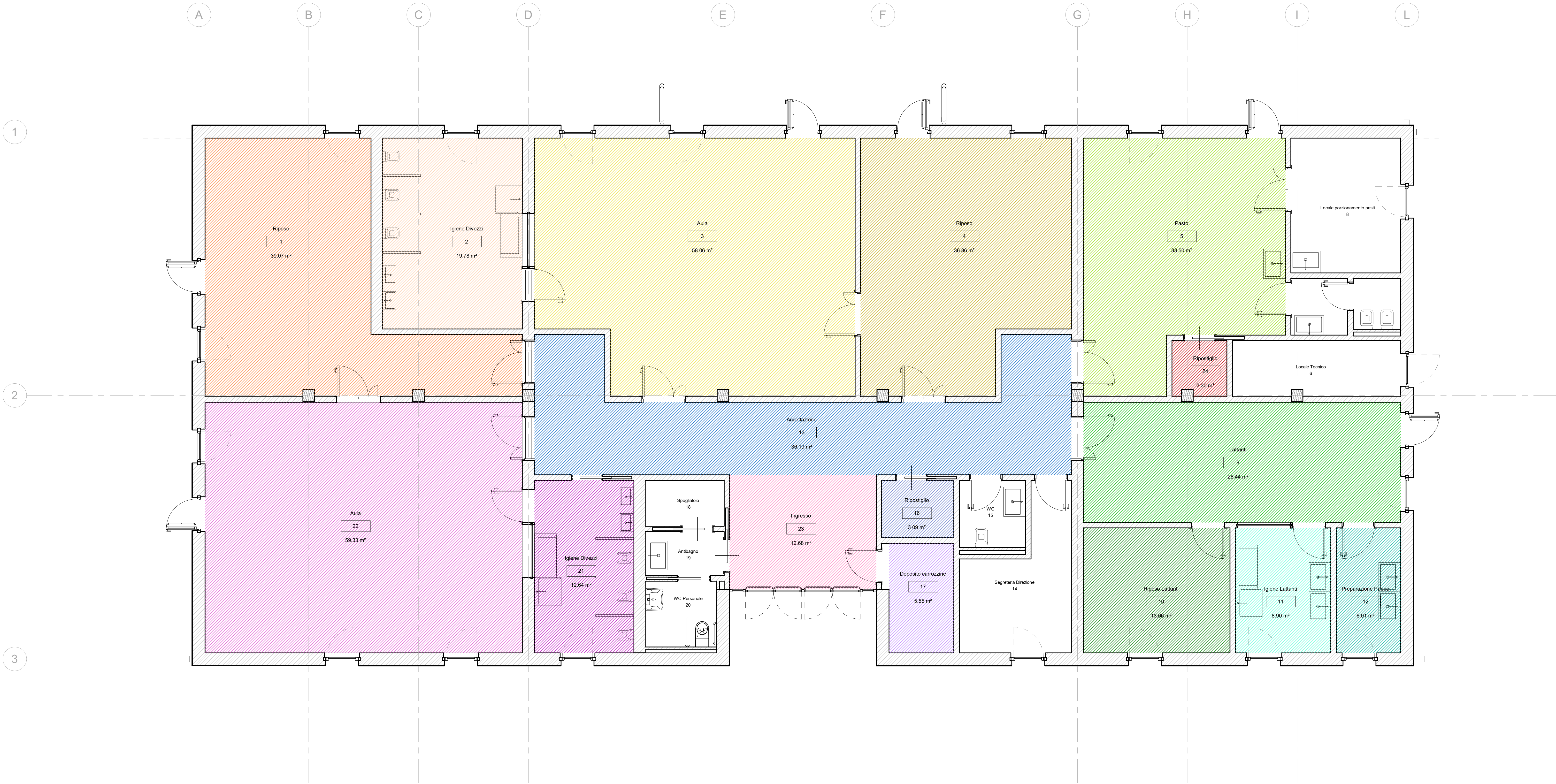
1 Pianta Piano Terra 1 : 50